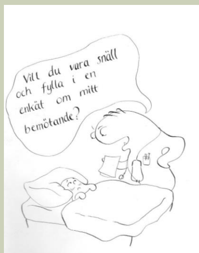
Illustration av Christina Erlander Klein ur Enkätmetodik – att planera och genomföra en enkätundersökning . Wenemark 2023. Liber förlag.

Vi fick dåliga resultat i Nationell patientenkät så vi vill genomföra en egen mätning. Vi har tidigare låtit personalen dela ut våra egna frågor till patienterna direkt efter besöket och då brukar de flesta vara nöjda. Vi brukar uppmana dem att lämna in blanketten direkt till vårdpersonalen innan de går – då får vi dessutom en mycket högre svarsfrekvens än i den nationella enkäten.