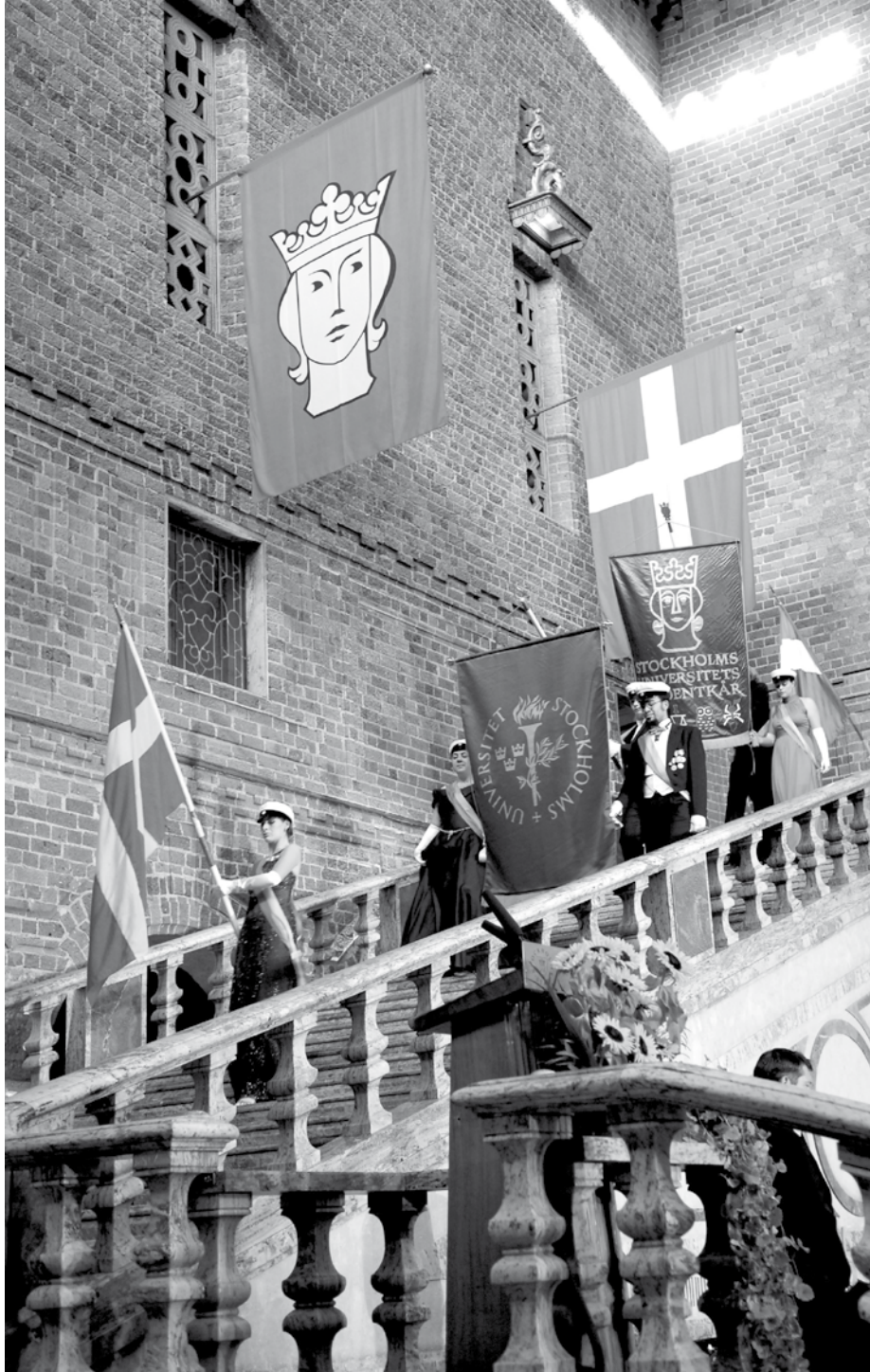
Promovering i Stockholms stadshus med äkta examen.

Kolla arbetssökandes cv. Tänk efter och kontrollera mot t.ex. internet. Heter LSE egentligen International London School of Economics som det står i arbetssökandes cv? Är University of Cambridge en avsiktlig felstavning? Ställ frågor