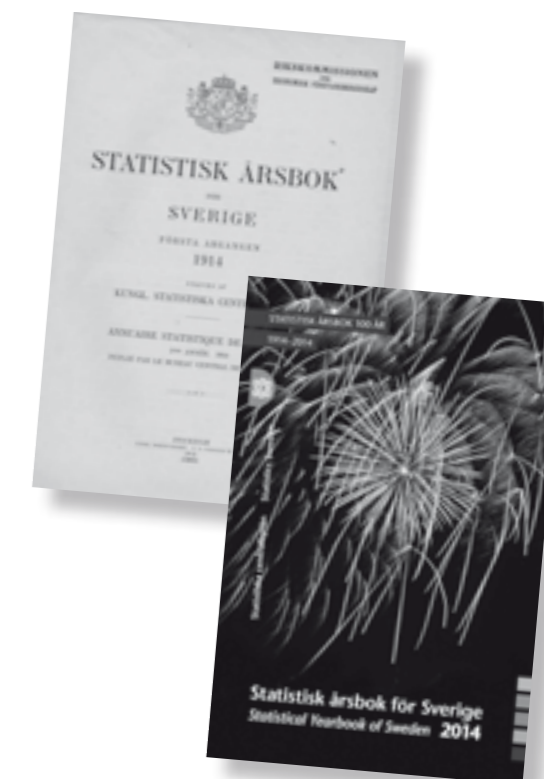
1914 och 2014 – första och sista förstasidan av Statistisk årsbok.

»De äldre årgångarna av årsboken har dock sin speciella charm och i såväl utformning som innehåll ger de en bild av ett svunnet Sverige. Om du vill botanisera i dessa "tidskapslar" så finns de alla tillgängliga på SCB:s webbplats»