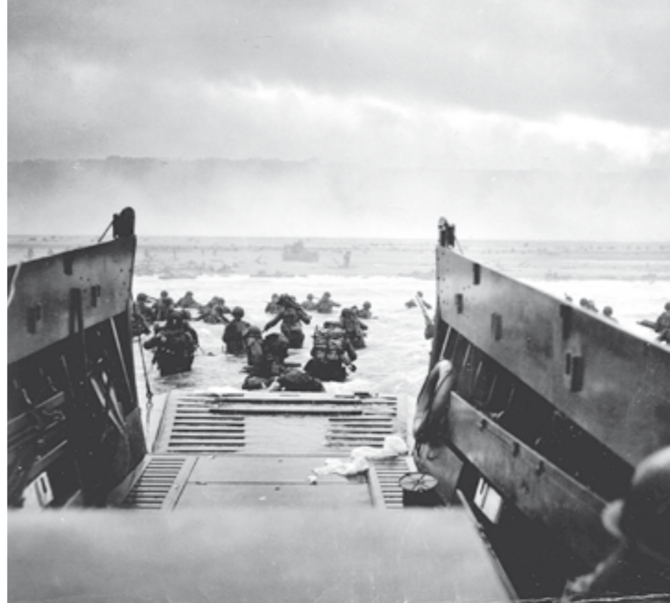
1944: Krig i Europa, dock inte i Sverige. Bilden från invasionen i Normandie.