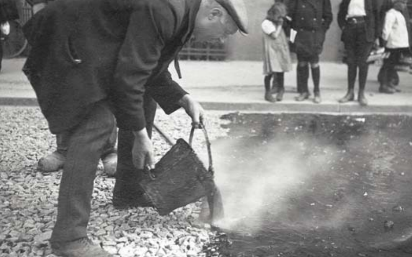
1914: Beläggning av en gata i Malmö med astfaltmakadam enligt genomdränkingsmetoden.