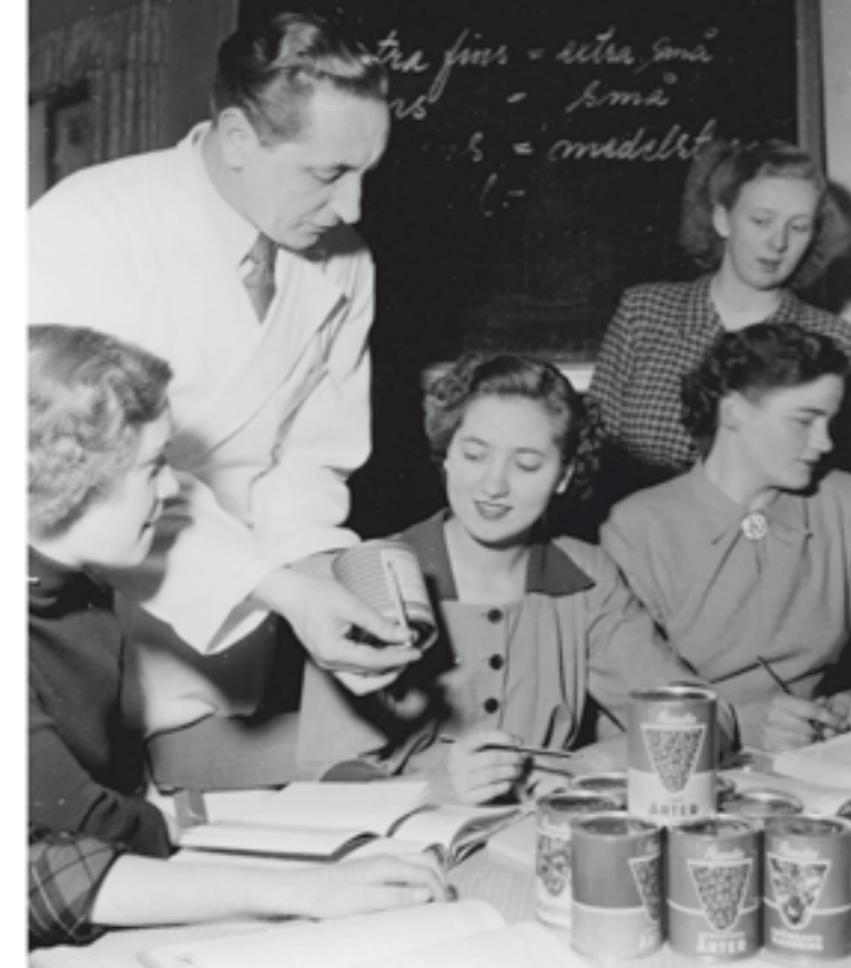
1954: Konserverade ärtor. Husmödrar på kurs hos Konsum.